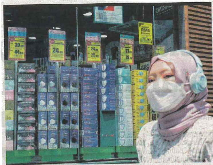
SEORANG gadis melalui depan sebuah premis menjual pelitup muka di Jalan Bukit Bintang, Kuala Lumpur. – GAMBAR HIASAN

AKHBAR : KOSMO MUKA SURAT : 4 RUANGAN : NEGARA