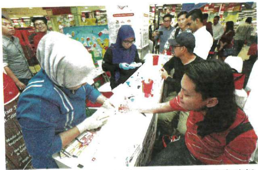
ORANG ramai disarankan untuk diagnosis kesihatan bagi memastikan penyakit dapat dikawal pada peringkat awal lagi. - GAMBAR HIASAN