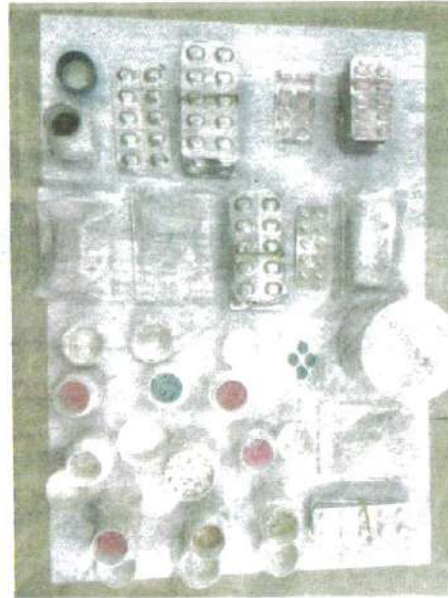
ANTARA produk dirampas anggota CPF dalam Ops Nilam di sebuah klinik perubatan swasta di Seremban.

“Siasatan awal mendapati produk itu diseludup masuk dari negara luar menggunakan laluan tidak sah dan dibekalkan kepada penagih dadah sekitar Negeri Sembilan,” katanya semalam.