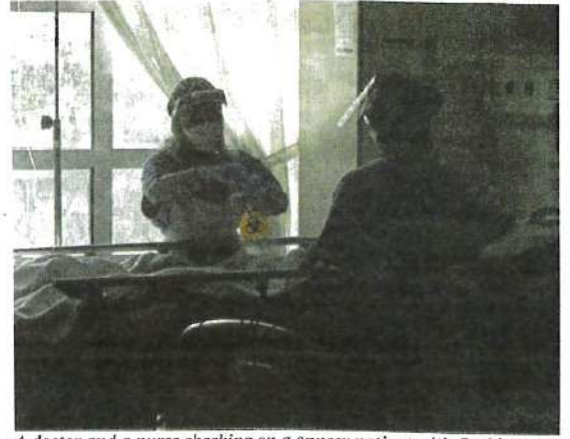
A doctor and a nurse checking on a cancer patient with Covid-19 at a hospital in Putrajaya yesterday.

As for adolescents, 2,912,234, or 93.6 per cent of those aged 12 to 17, have received two doses, and 3,004,564, or 96.4 per cent, have received at least one dose.